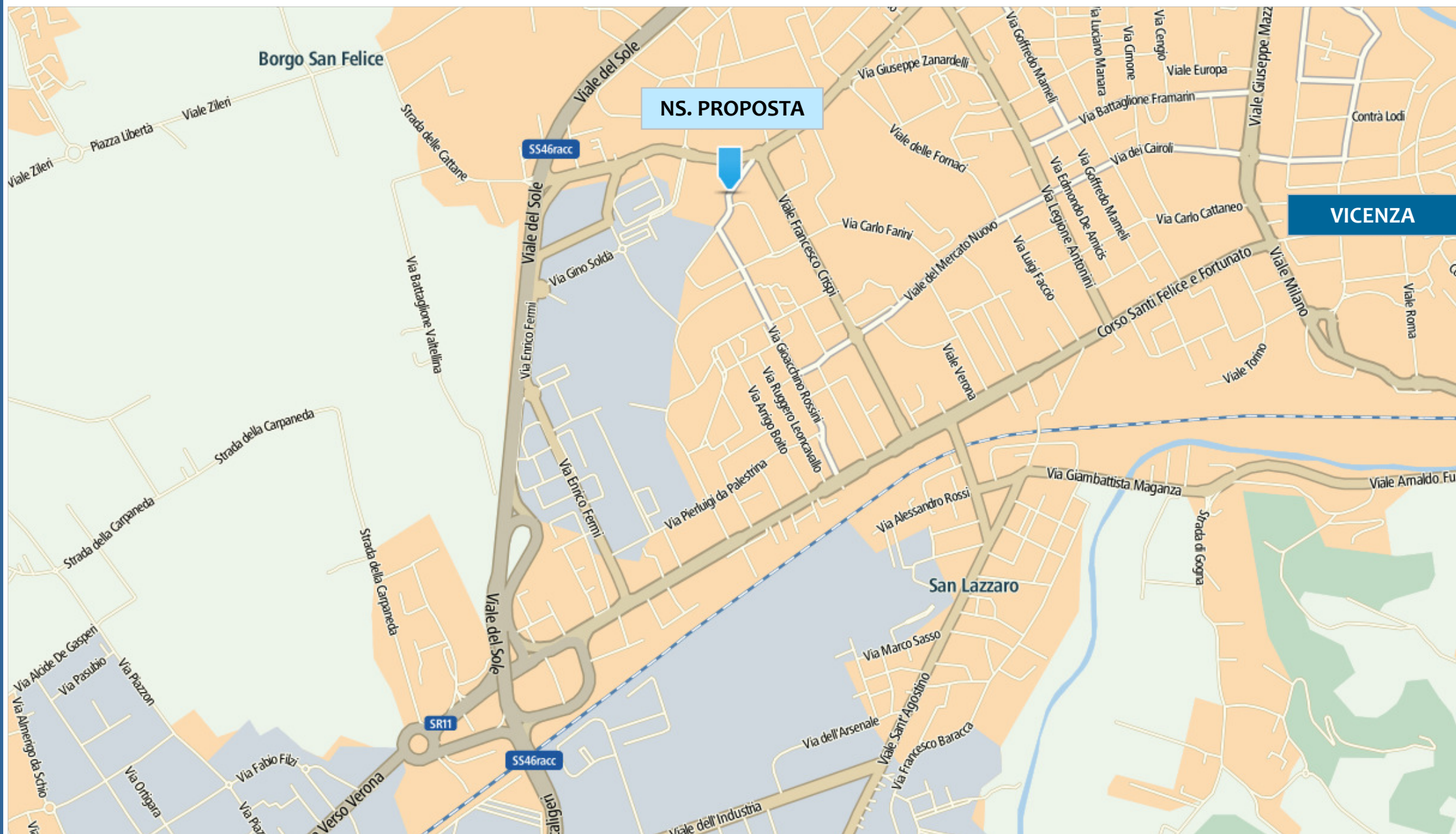
Vicenza comparto «Cime-Marchiol»