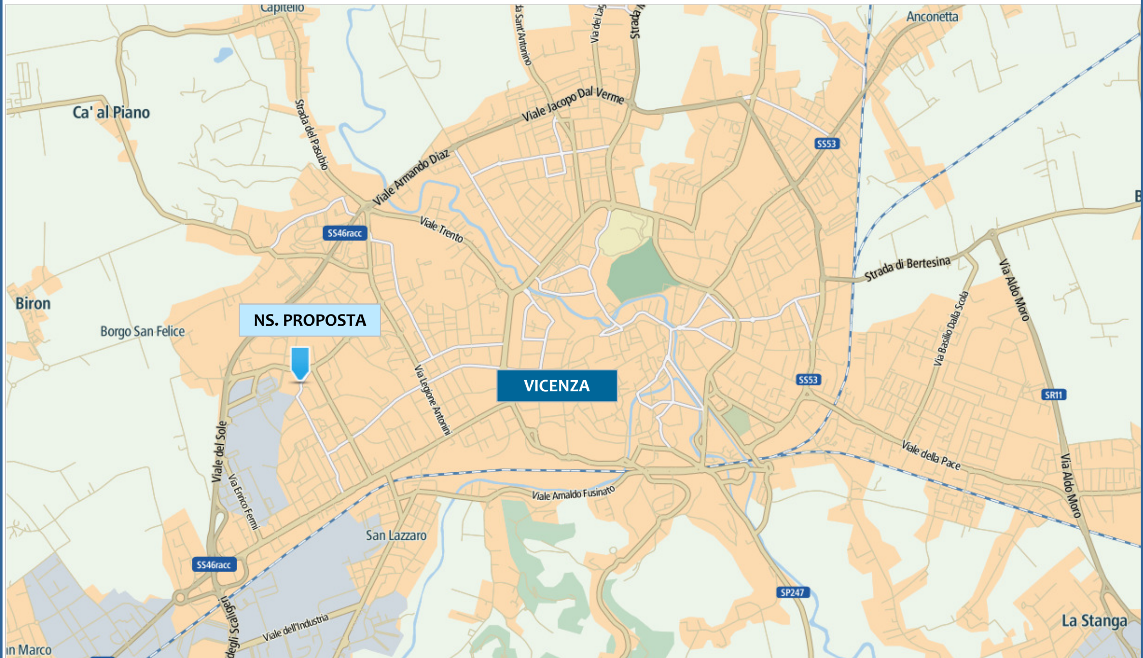
Vicenza comparto "Cime-Marchiol»